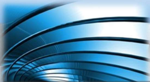
Reel to Reel line